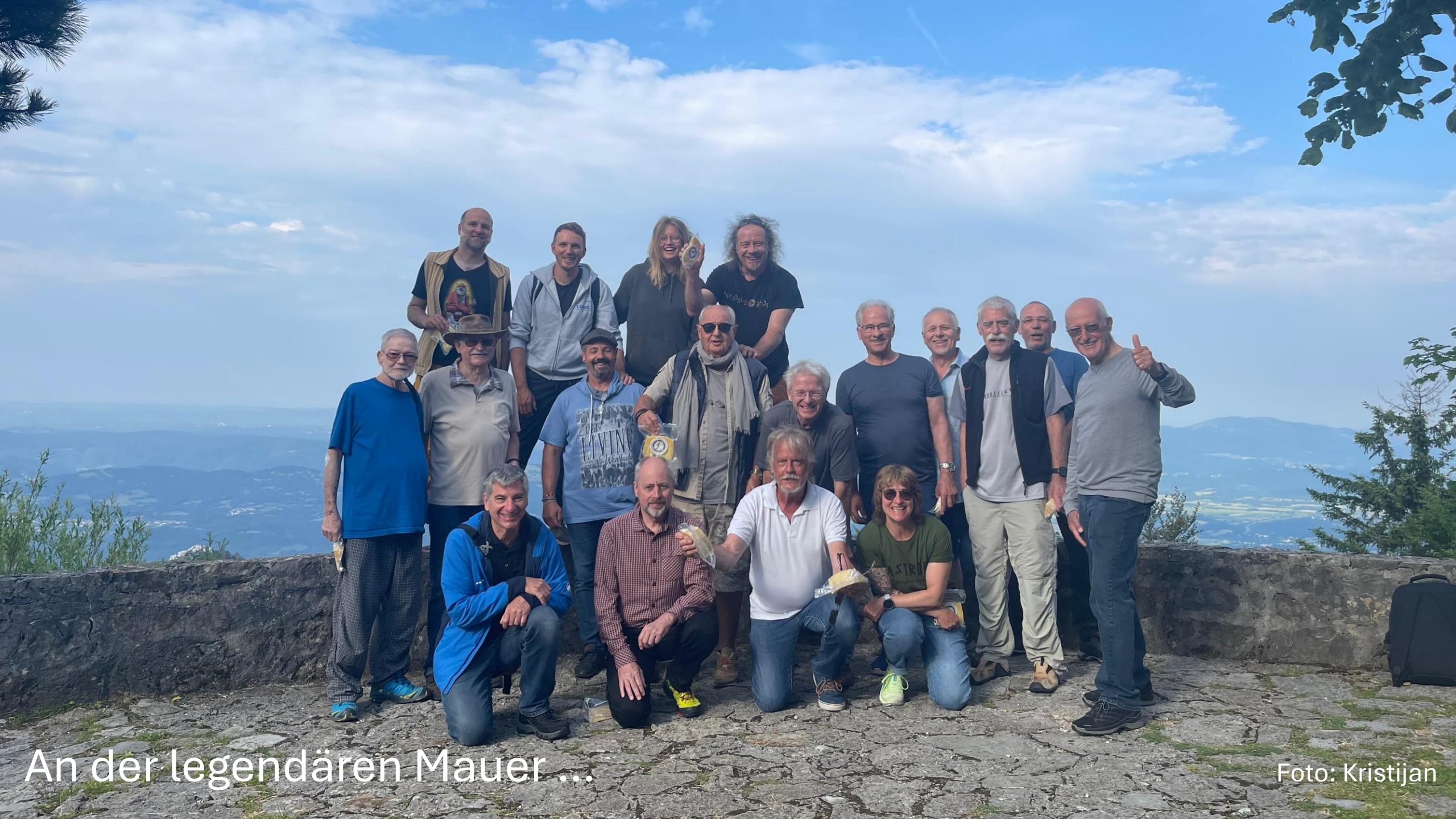
An der legendären Mauer ...