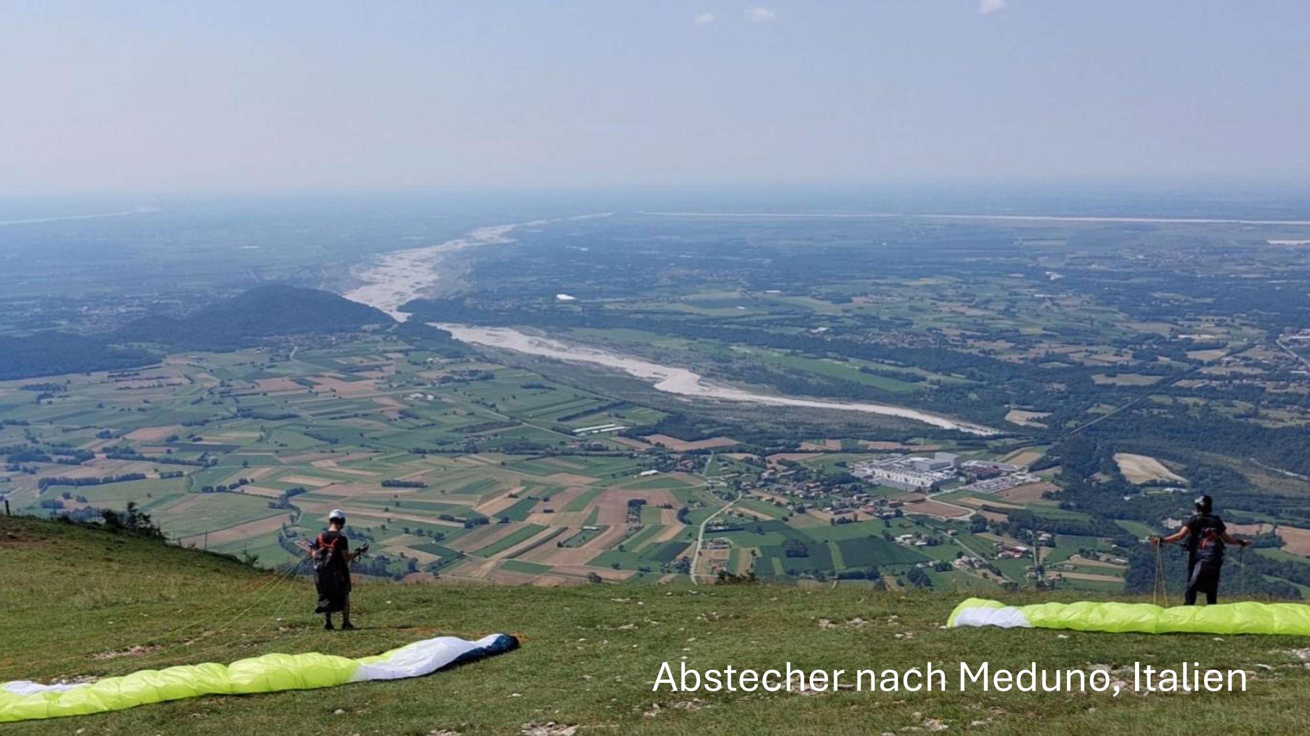
Abstecher nach Meduno, Italien